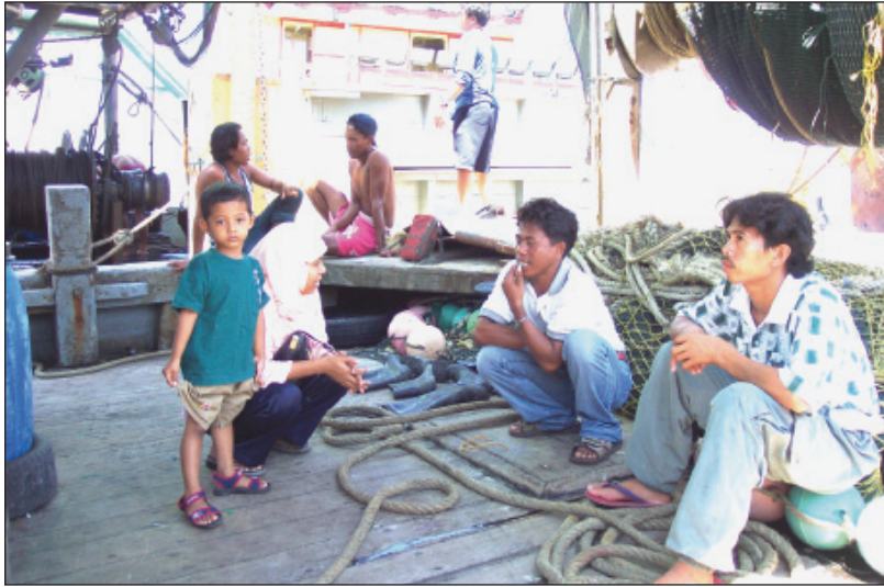
Gambar 4. Buruh Perikanan Asing Pukat Tunda, Bugis (Indonesia) di Daerah Perikanan Kota Kinabalu sedang bersembang sambil berehat selepas mendaratkan ikan (Gambar oleh diambil Mohammad 'Azzam Manan pada 8hb. Ogos 2002).

majikan dan pemborong mengikut jenisnya. Harga ikan gred satu yang terdiri daripada ikan-ikan yang bersaiz besar ditetapkan berdasarkan berat sekilogram, sementara harga ikan-ikan bersaiz kecil termasuk ikan baja dikira dengan bakul.