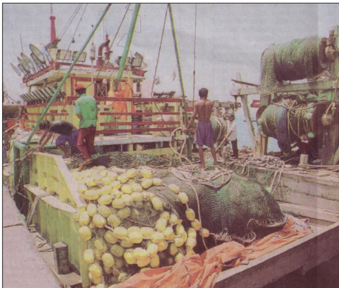
Gambar 1. Kerja-kerja buruh perikanan asing dalam penyelenggaraan bot pukat jerut sebelum bertolak ke laut (Sumber: The Borneo Post , 1 Mac 2003).

Kerja-kerja memperbaiki pukat akan dilakukan di atas bot. Pukat yang koyak cukup parah akan diturunkan dari atas bot dan dijahit bersama-sama di kawasan jeti pendaratan ikan untuk memendekkan masa kerja (Gambar 2). Sering berlaku