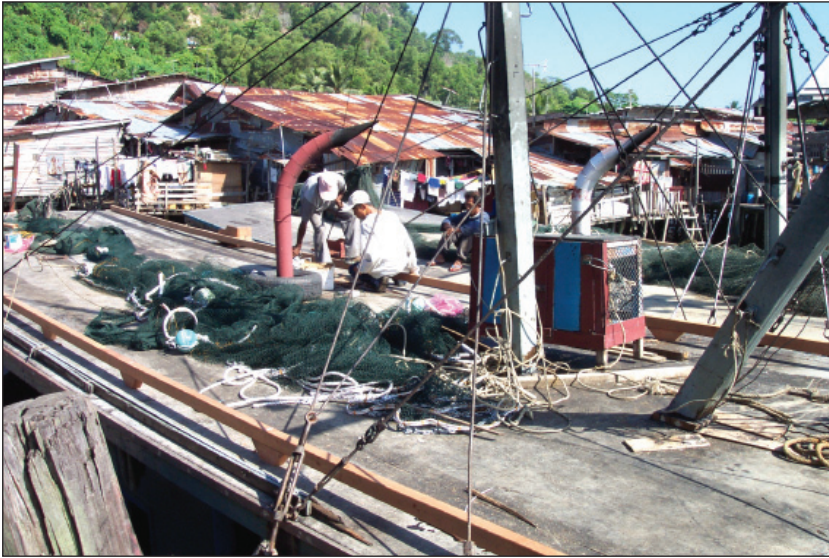
Gambar 2. Buruh Perikanan Buton (Indonesia) sedang mengurus pukat yang koyak berhampiran jeti pendaratan ikan North Borneo di Daerah Perikanan Sandakan (Gambar diambil oleh Mohammad 'Azzam Manan pada 28hb. Januari 2003).

operasi menangkap lewat dijalankan kesan pukat tidak siap dibetulkan tepat pada masaya. Kebolehan menjahit pukat amat diperlukan daripada seluruh buruh perikanan asing yang terlibat. Pukat yang sukar untuk dijahit semula kerana terkoyak cukup parah akan diganti oleh majikan dengan pukat yang baru.