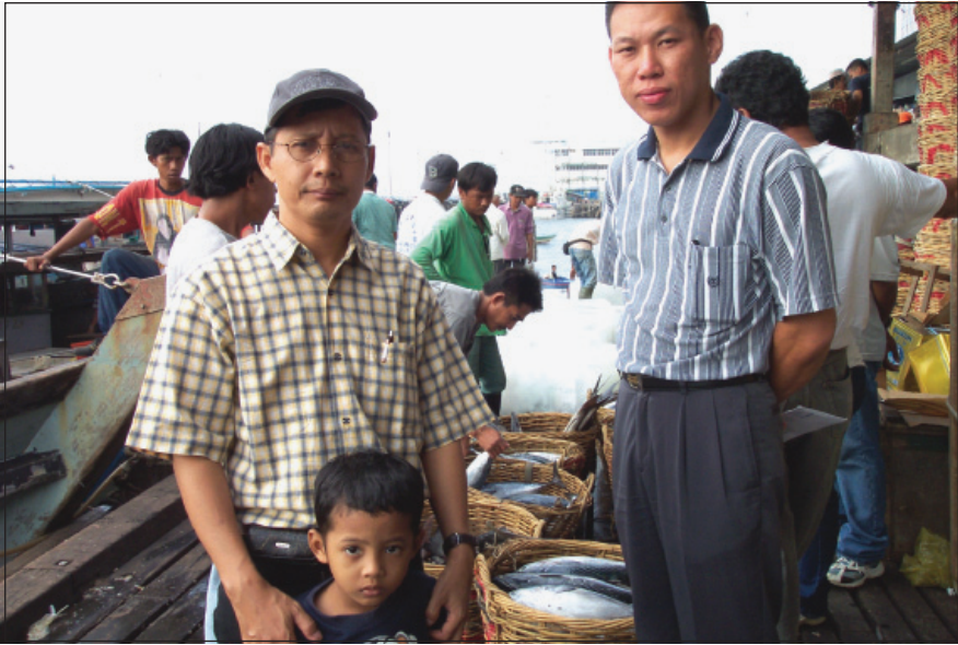
Gambar 3. Buruh perikanan pukat tunda, Buton (Indonesia) sedang mendaratkan ikan di jeti pasar ikan Sandakan.

pekerja yang sangat kuat. Mengharungi laut yang seringkali bergelora selama sehari-hari bukanlah perkara mudah yang dapat dilakukan oleh sesiapa pun juga, terutama oleh rakyat tempatan Sabah. Oleh itu, aktiviti perikanan ini secara majoritinya dijalankan oleh buruh perikanan asing seperti dari Indonesia, 3 kerana rakyat tempatan memang kurang memberi perhatian yang cukup terhadapnya.