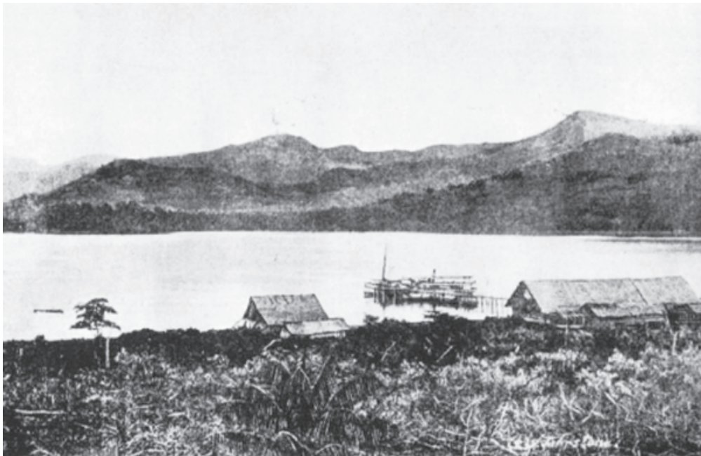
Gambar 3 : Ambong, Kawasan Pentadbiran British yang diserang oleh Mat Salleh pada tahun 1897