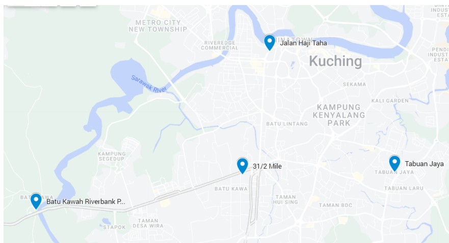
图 2：张姓发音人的几个居住地点