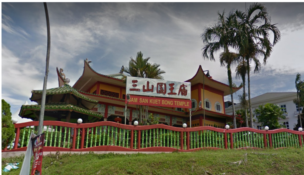
图 3：七哩三山国王庙招牌

拉越古晋客家人有印尼移民的痕迹以及市区以福建话为商业用语的背景，[v]至[b]的语音演变很可能是在外语以及福建话的双重夹击下产生的演变。