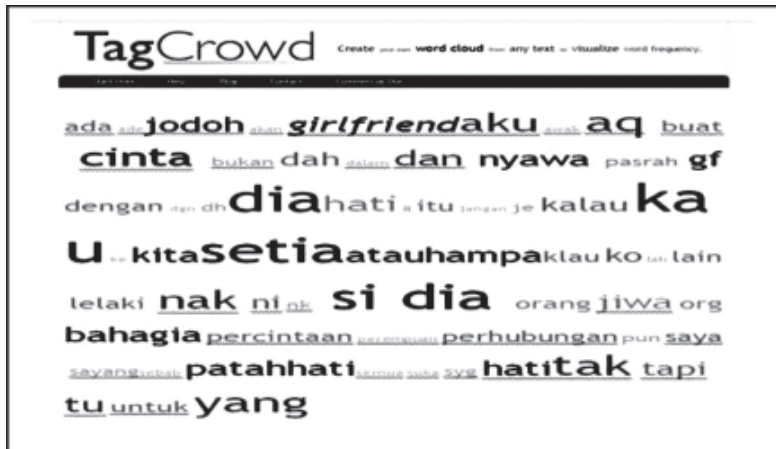
Gambar 1.0: Tagcrowd bagi tema perhubungan

Kesimpulannya, keempat-empat subtema (subtema percintaan, komuniti, persahabatan, dan kekeluargaan) telah menunjukkan satu pertalian dan menduduki kelompok tema yang hampir sama, iaitu perhubungan. Perkara ini turut diserlahkan melalui bukti leksikal dalam lingkaran yang hampir sama antara keempat-empat subtema iaitu, [aku], [dia], [kawan], [sahabat], [geng], [kita], [ibu], [mak cik], [adik beradik], [mak], [ayah], [ibu], [abah], [broken], [jatuh hati], [jodoh], [bahagia], [si dia], [setia], [hati], [gf], [ girlfriend ], [putus], [rindu], [merindu], [sayang], [setia], [nyawa], [hampa], [bahagia], [derita], [hati hancur], [sayang], [relationship], [ couple ], [kapel], dan [kahwin].