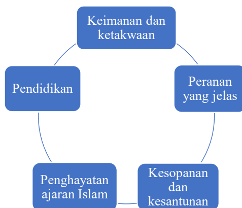
Rajah 1: Teras Pembinaan Keluarga Harmoni

Tuntasnya, konsep keluarga sejahtera menurut perspektif Islam melibatkan kesejahteraan jasmani, rohani, emosi dan intelektual yang dibina atas dasar keimanan, kasih sayang, tanggungjawab serta pendidikan yang seimbang. Sehubungan dengan itu, institusi keluarga yang berlandaskan prinsip-prinsip ini mampu mewujudkan kebahagiaan, sekaligus menjadi penanda aras kepada kestabilan sosial dan pembinaan tamadun yang berjaya. Justeru, usaha memperkukuh institusi keluarga Islam perlu dijadikan keutamaan bagi merancang pembangunan masyarakat yang inklusif.