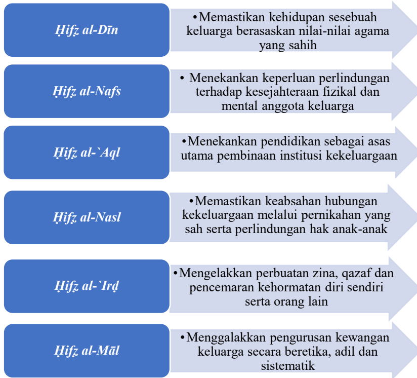
Rajah 3: Prinsip Maqāṣid al-Sharī'ah sebagai Asas Penguken Keluarga