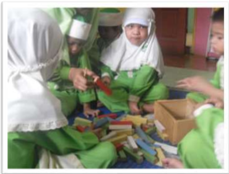
Kanak-kanak saling berkomunikasi dan bekerjasama dalam membina blok-blok kayu.