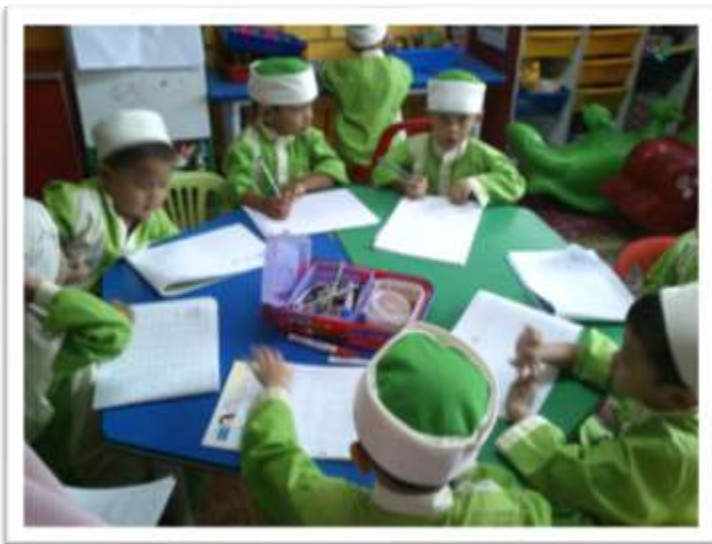
Jadual Bergambar 2: Aktiviti pembangunan kognitif di PASTI

Aktiviti latihan dalam kumpulan membantu mereka mengembangkan kognitif dan menyelesaikan masalah.