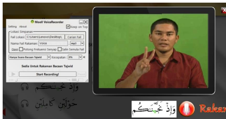
Rajah 3: Skrin menunjukkan paparan dalam Multimedia Mod Pengecaman Suara

MMPS mempunyai sistem merakam suara. Ini adalah satu tambahan ikon kepada MMB. Ciri ini bertujuan memberi peluang murid merakamkan suara sendiri dan membandingkan bacaan sendiri dengan bacaan qari. Menurut Teori Pembelajaran Melalui Pemerhatian Bandura (1977), murid suka meniru perlakuan model dan akan merasa puas hati apabila terdapat kesamaan perlakuannya dengan model. Rajah 3 menunjukkan paparan skrin MMPS.