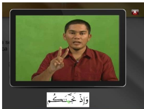
Rajah 1: Skrin menunjukkan paparan dalam Multimedia Mod Berasingan.

MMB menggabungkan elemen multimedia iaitu teks, grafik, audio, video dan interaktiviti dalam persembahannya. Fokus mod adalah teks atau kalimah yang dibaca oleh qari berada berasingan dari video bacaan qari. Menurut kajian Irfan dan Zubir (2010), elemen multimedia terutama video dapat meningkatkan pencapaian murid. Rajah 1 menunjukkan paparan skrin MMB.