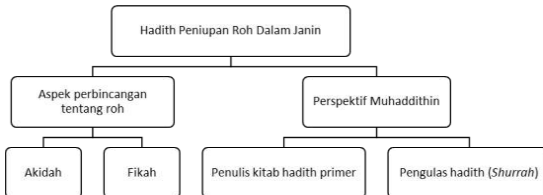
Rajah 1: Perbincangan Muḥaddithīn Tentang Peniupan Roh Dalam Janin