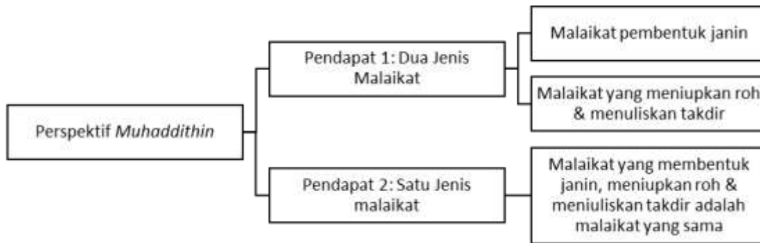
Rajah 3: Pendapat Muḥaddithīn tentang Malaikat Yang Membentuk Janin