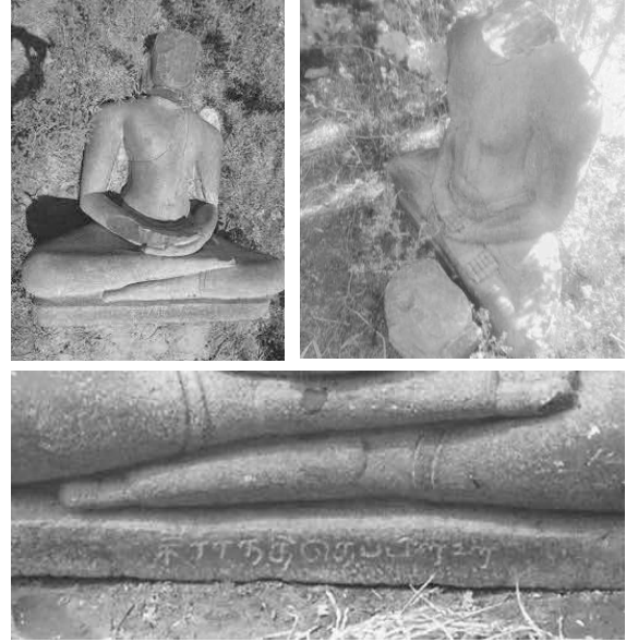
வேளாங்கண்ணி சந்தைத்தோப்பு புத்தர்