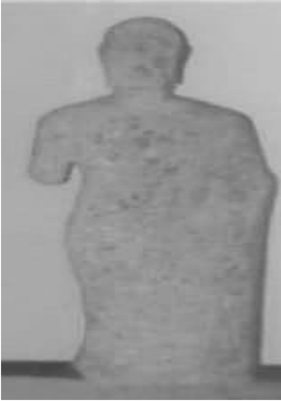
கிராந்தி புத்தர் சிலை

படம்.10. புத்தர் சிலை, பூம்புகார் ஆழ்கடல் அகழாய்வு வைப்பகம்.