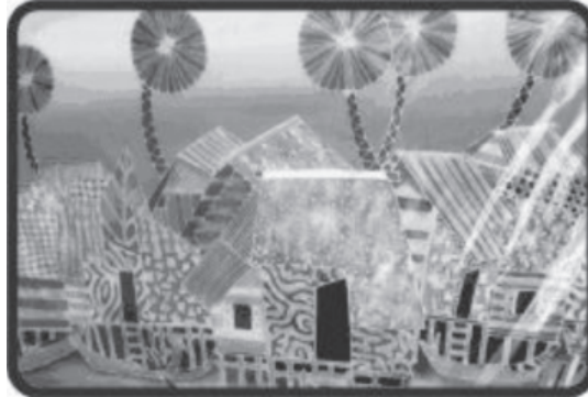
Gambar 6: Motif geometric

(1969) mendefinisikan penghasilan imej yang paling tinggi nilai dalam persepsi visual adalah karya seni berbentuk abstrak.