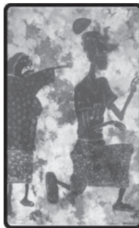
Gambar 7: Motif figuratif (Peristiwa seorang isteri meleteri suaminya)

Seni diluahkan menerusi ekspresi manusia terhadap apa yang dilihat dan diluahkan sebagai bahasa komunikasi. Merujuk Figura 7 yang menggambarkan fenomena biasa dalam kehidupan berumah tangga apabila seorang isteri meleteri suaminya. Ekspresi lucu yang dihasilkan menerusi sentuhan batik lukis oleh penggiat menunjukkan bahawa pengalaman dan pemerhatian ke atas sesuatu peristiwa telah memberi idea kepada penggiat untuk berekspresi di atas kanvas. Ekspresi ini merupakan luahan spontan daripada seorang penggiat di Natural Batik Village iaitu Encik Ghazali yang kebetulan baru mendirikan rumah tangga.