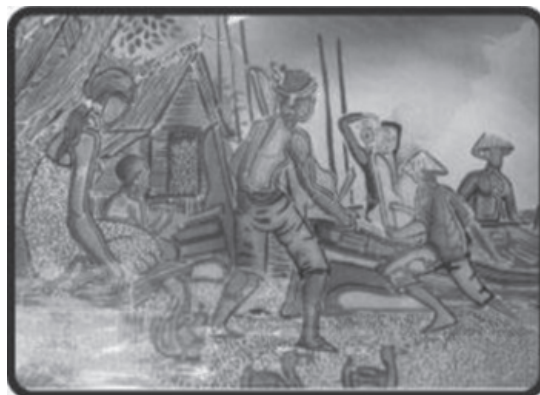
Gambar 2: Motif Figuratif (Nelayan baru pulang daripada menangkap ikan di laut)