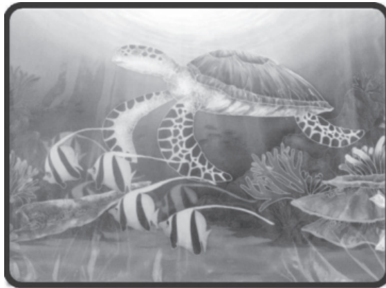
Gambar 3: Motif fauna yang dihasilkan oleh penggiat

Berdasarkan lukisan batik di atas memperlihatkan keinginan penggiat iaitu Encik Ghazali bin Che Omar untuk berekspresi dengan kehidupan dalam sebuah perkampungan nelayan di pinggir laut. Pengaruh persekitaran di antara kreatifiti penggiat dengan kehidupan masyarakat sekeliling telah mencetuskan idea ini. Ia menggambarkan kecekalan masyarakat Melayu di kawasan pesisiran pantai yang sinonim dengan aktiviti penangkapan ikan. Penghasilan motif figuratif dalam batik lukis merupakan motif yang menjadi tarikan utama peminat seni halus berkunjung ke Natural Batik Village di Pahang.