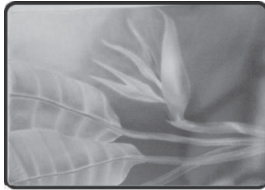
Gambar 4: Motif flora (sepit udang)

Motif flora dalam Gambar 4 seperti di atas memperlihatkan pengamatan yang sangat teliti oleh penggiat dalam menunjukkan keindahan alam hasil ciptaan tuhan. Motif ini adalah sebahagian daripada imej bunga kiambang yang lebih dikenali sebagai sepit udang oleh Encik Ghazali. Nilai seni atau artistik yang dihasilkan menerusi batik lukis ini menjelaskan minat dan ketekunan penggiat dalam usaha mengekalkan seni warisan Melayu di negara ini.